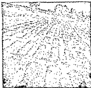
सिंचाई और भादू की बोआई

तीसी ( अलसी ) थीं । थोड़ी-सी जमीन में धान की फसल ली जाती थी और थोड़ा-बहुत तिल भी उगाया जाता था । अब गाँव में खरीफ और रबी दोनों ही फसलें उगायी जाती हैं । गर्मों में भी कुछ हरी-भरी धरती देखने को मिलती है और कुछ तरकारियाँ भी प्राप्त होती रहती हैं । मकई और तासी के अलावा आलू, गेहूँ, मिर्च, बैंगन, टमाटर, गोभी, प्याज आदि फसलें भी ली जाती हैं ।